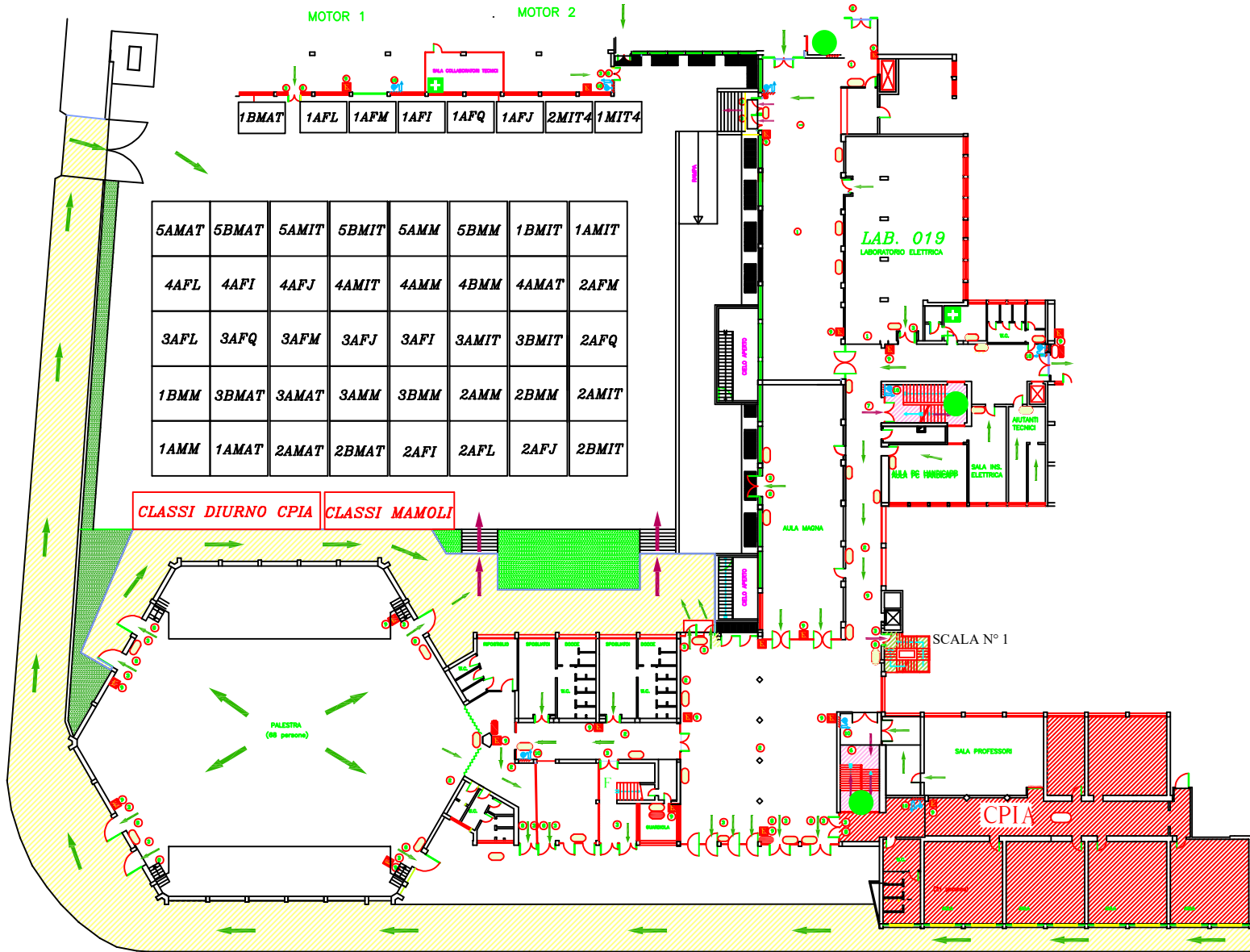
PIANTA PIANO TERRA DISPOSIZIONE CLASSI PUNTO DI RACCOLTA CLASSI DIURNO CORTILE DI FRONTE ATRIO BAR